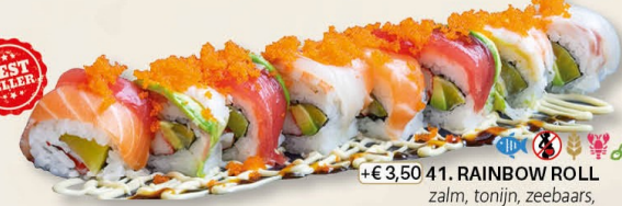
+€ 3,50 41. RAINBOW ROLL zalm, tonijn, zeebaars, krabstick, avocado - 8 st.