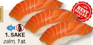
1. SAKE zalm, 1 st.