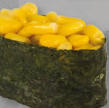
12. CORN SARADA mais salade