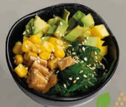
46. VEGGIE POKE BOWL tofu en mais