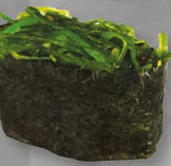
14. CHUKA WAKAME zeewier