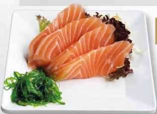
+€ 2,00 43. SAKE rauwe zalm - 4 st.