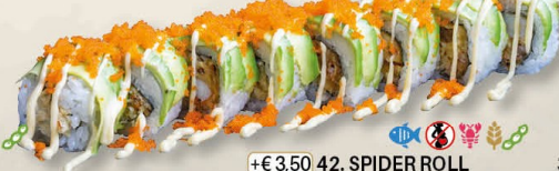
+€ 3,50 42. SPIDER ROLL gepaneerde soft-shell krab, avocado - 8 st.