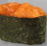
10. SAKE zalm