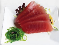
+€ 2,50 44. MAGURO rauwe tonijn - 4 st.